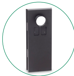
LATO ASPIRAZIONE (CONNESSIONE ESTERNA), 1 PZ PER UNITÀ